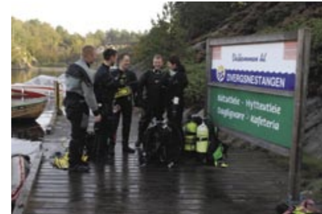
En gjeng tyske dykkere diskuterer dagens dykk på brygga utenfor senteret, som ligger ca. 8 kilometer øst for Kristiansand.

og det ser ikke ut til at det plager han at jeg sakte, men sikkert nærmer meg redet. Jeg setter meg på bunnen bare en meter fra og observerer den spesielle, nesten aggressive adferden. Med jevne mellomrom svømmer den en runde og kommer i full fart tilbake.