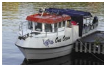
Den romslige dykkebåten har blant annet 6 dusjer på dekk for skylling av utstyr og kameraer, og 220V stikkontakter hvis man trenger å lade opp noe.